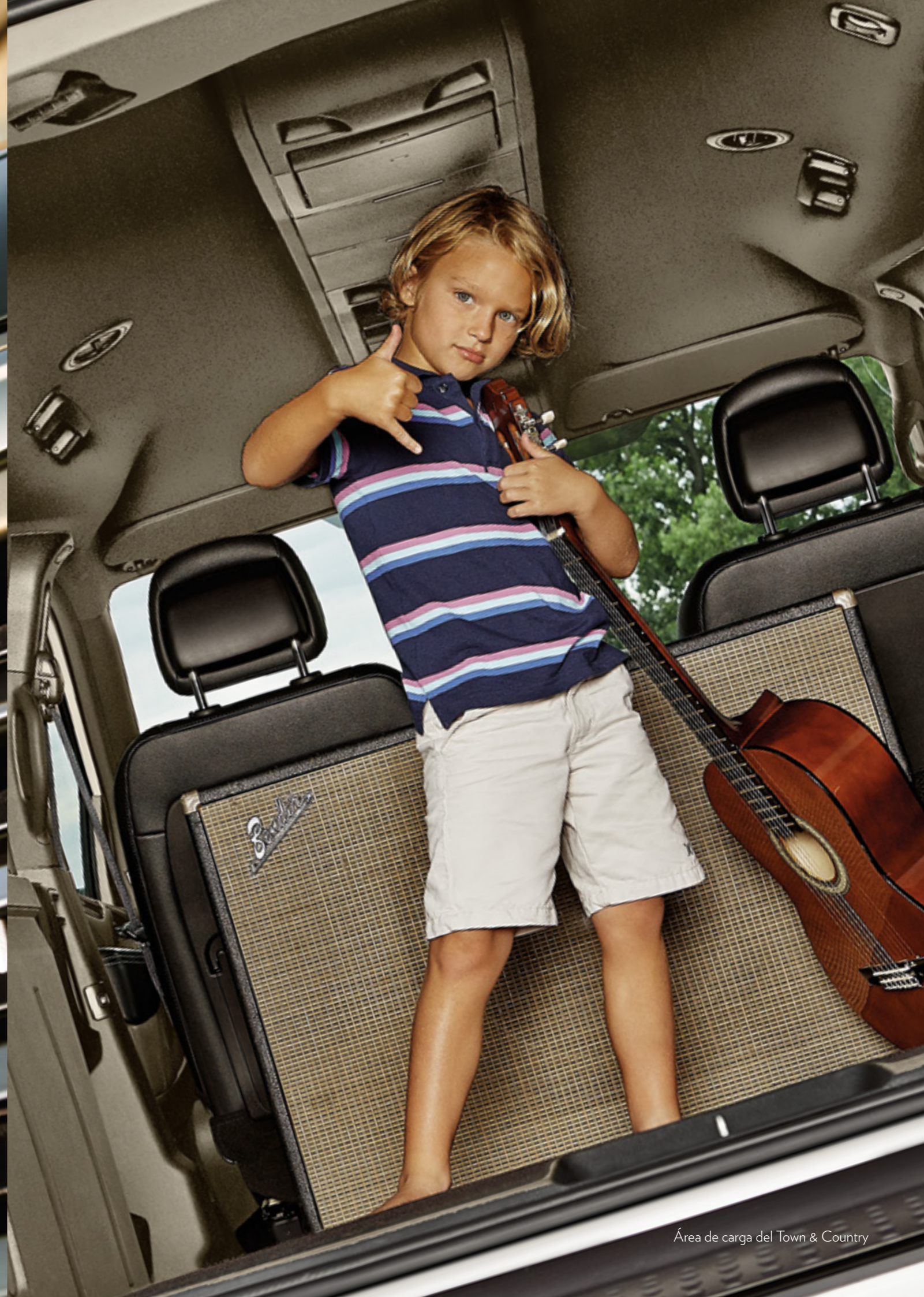
Área de carga del Town & Country