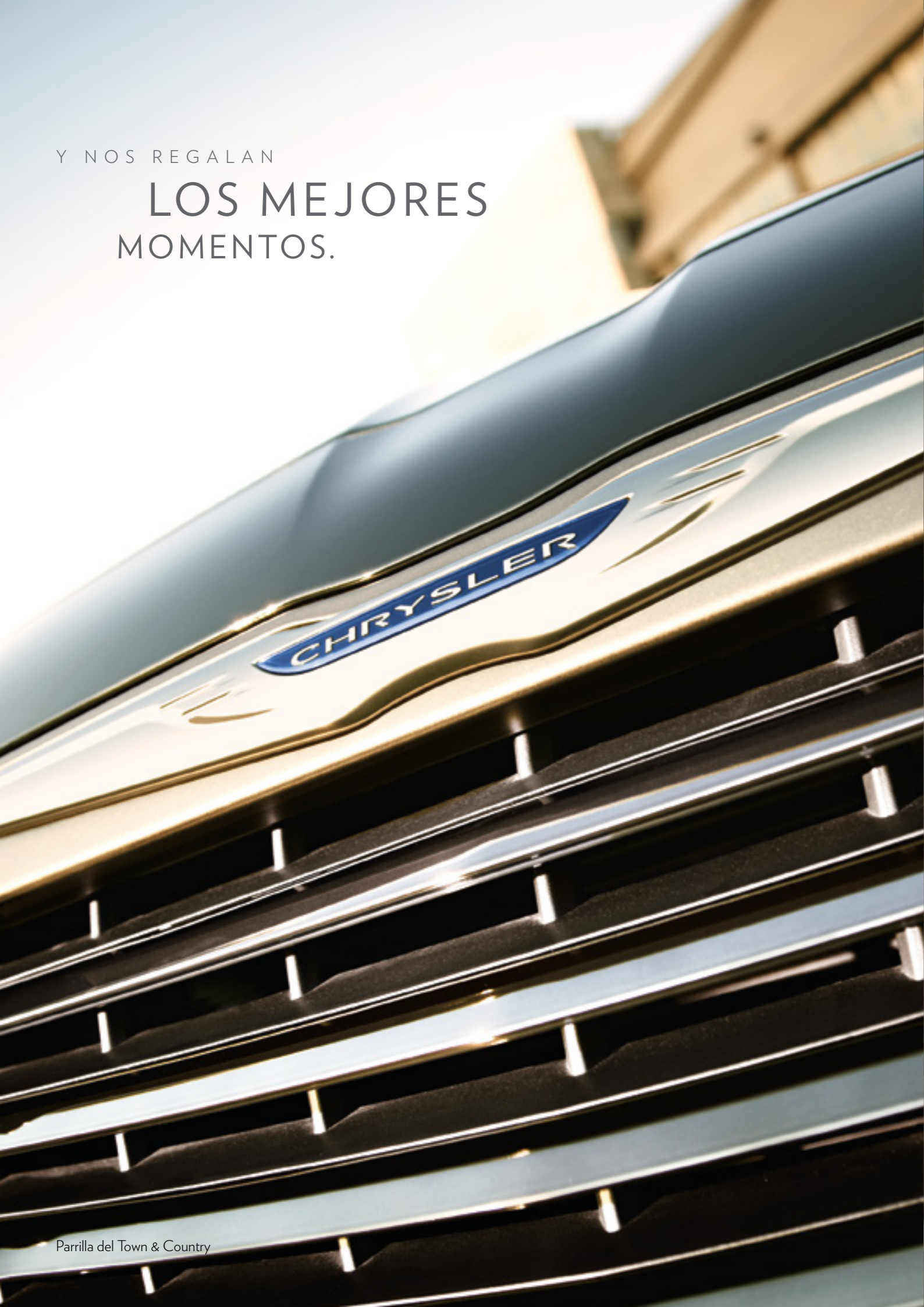
Parrilla del Town & Country